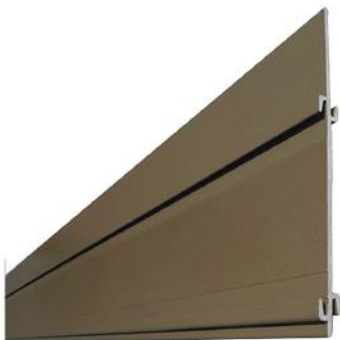
Détail du profilé