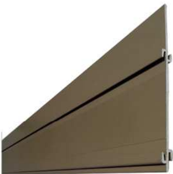
Détail du profilé